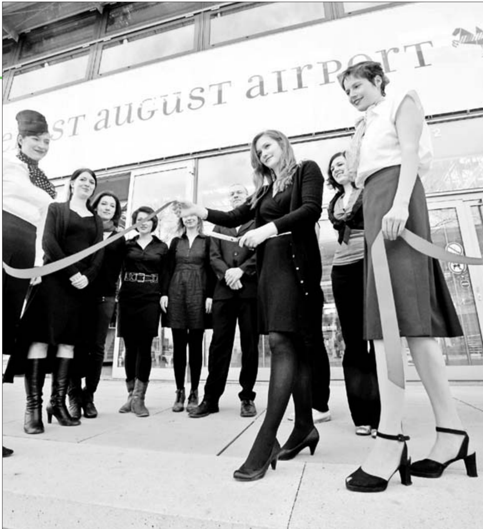
ABFLUG: Studenten der Fachhochschule eröffnen den Ernst-August-Airport. Die Stewardessen-Kostüme sind selbst gestaltet.

■ Flugtickets für den „Ernst-August-Airport“ gibt es für zehn Euro (ermäßigt acht Euro) auf www.f3.fh-hannover.de und bei der Hannover Marketing und Tourismus GmbH (Ernst-August-Platz 8).